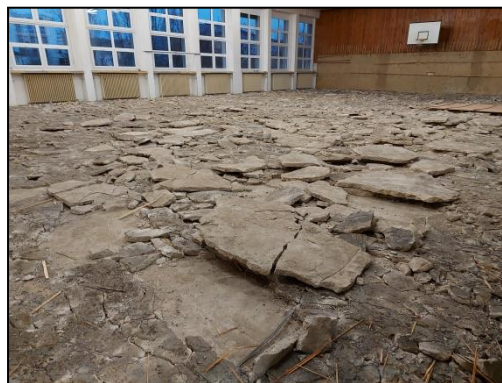
...prostě nám ve škole nezůstal kámen na kameni...

Pedagogové zpracovali žádosti do grantového řízení MHMP s cílem získat finanční podporu pro studijní pobyt našich žáků v partnerské škole v USA, v Rakousku a v Moskvě, příspěvek na motivaci zájemců o matematiku a fyziku formou akce Arabský[mafyn], příspěvek na další ročník republikové soutěže v 3D tisku, kterou tradičně organizujeme. Školní poradenské pracoviště předložilo grantové žádosti na Městskou část Praha 6 a MHMP na finanční podporu adaptačního kurzu „Seznamme se!“ pro budoucí první ročník.