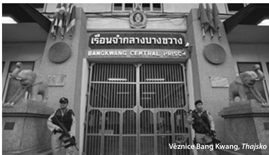
Věznice Bang Kwang, Thajsko