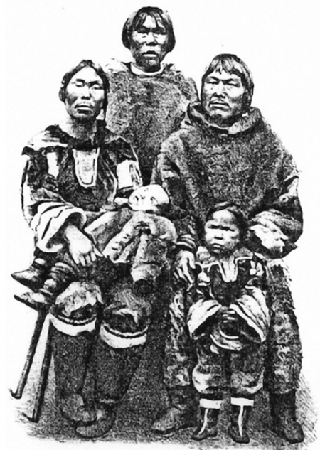
Rodina Eskymáků v zoo v Hamburgu

Poprvé se takto dovezení domorodci objevili v 70. letech 19. století. Průkopníkem byl německý obchodník se zvířaty Carl Hagenbeck. Ten poprvé představil