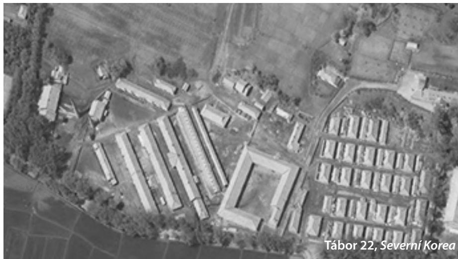
Tábor 22, Severní Korea