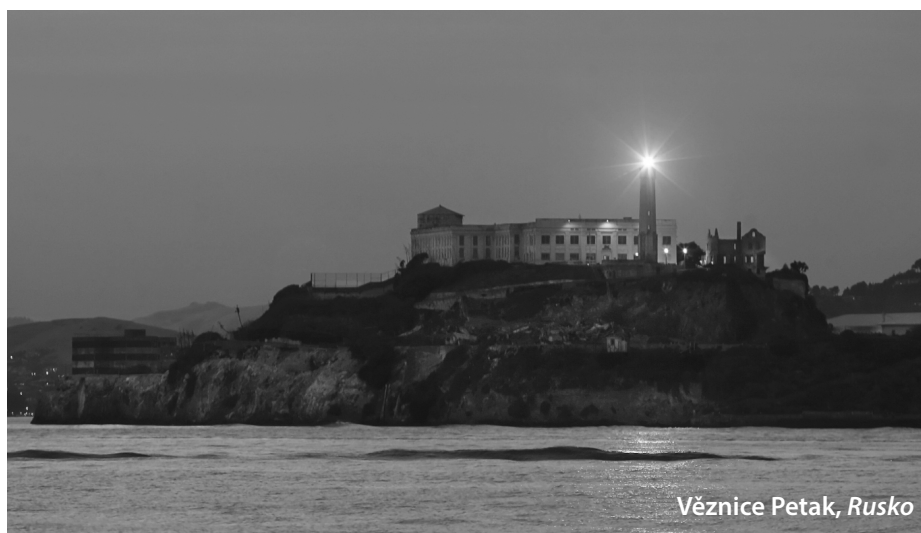
Věznice Petak, Rusko

Všichni máme o vězení zhruba stejnou představu. Místo, kde si vězni odpykávají trest. Ranní budíček, jídlo několikrát denně, občasné vycházky. Není to nic moc, avšak v porovnání s některými jinými věznicemi se jedná o pětihvězdičkový hotel. Tento článek vás zavede na prohlídku těch nejhorších z nich.