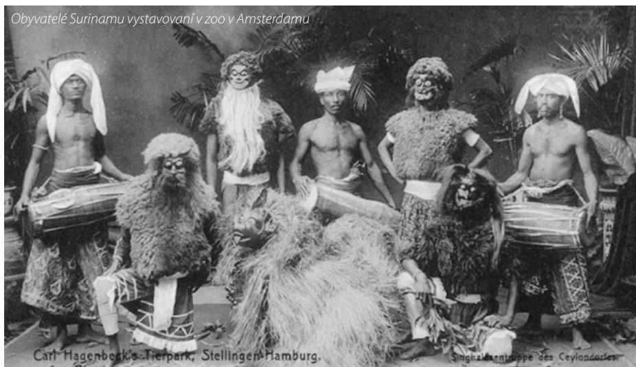
Obyvatelé Surinamu vystavovaní v zoo v Amsterdamu