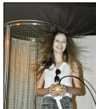
účastníci TSC

Z ohlasů studentů nejen vyplývá, že exkurze ve výzkumném středisku byla hlavní metou a zlatým hřebem TSC, protože toto místo jen tak někdo nenavštíví, ale také, že si každý mohl na TSC najít něco svého, co ho zaujalo. Ať už se jednalo o katedrálu, ženevský vodotrysk, způsob bydlení v hotelu F1, stravování v restauraci Flunch nebo navázání nových kontaktů se spolužáky z jiných tříd.